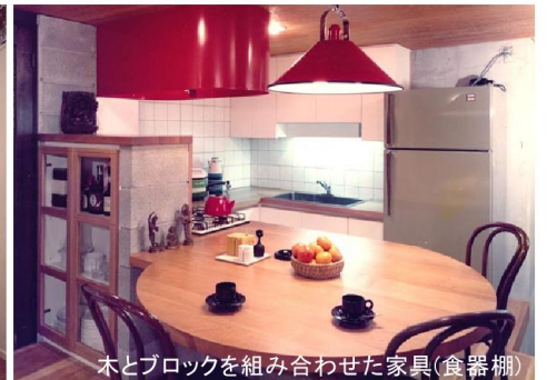
木とブロックを組み合わせた家具(食器棚)