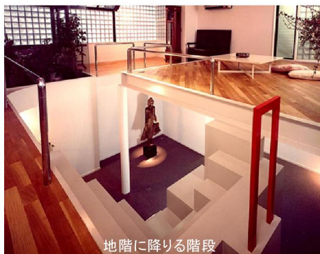
地階に降りる階段

1982年竣工の第6号『都住創中大江』は狭い土地に、入居者は30~35歳で予算も非常に厳しい条件でしたが、夢多い方たちの城を完成させることができたのが、私の都住創デビューとなりました。