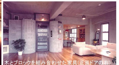
木とブロックを組み合わせた家具(正面ドアの右)