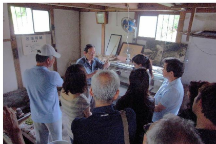
原料・工程などの説明を受ける