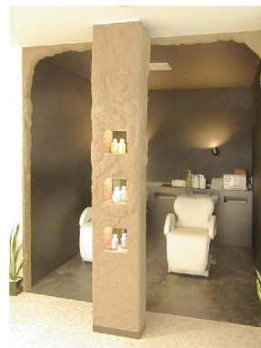
オーナーカクの洞窟イメージのシャンプーブース