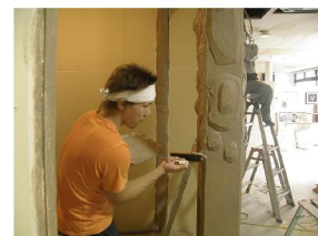
カットハサミを左官ごてに持ち替えてハンドクラフトに挑むオーナー