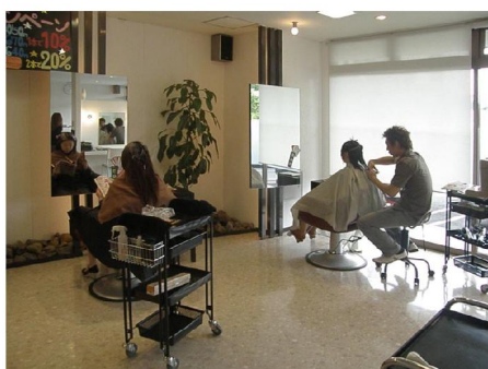
初期オープン時のスタイリングエリアで仕事するオーナー(右端)