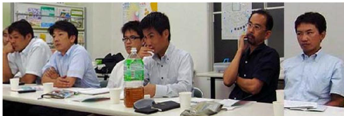
大家工青年部の参加者は右から