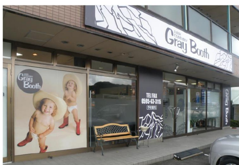
エントランスサイン