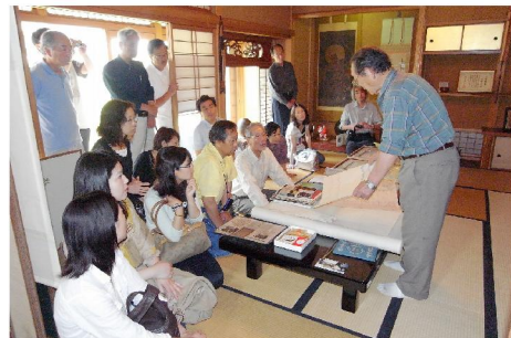
名塩和紙についていろいろな話を聞く