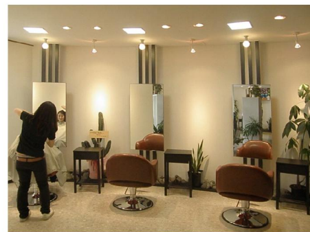
今回増床のスタイリングエリア