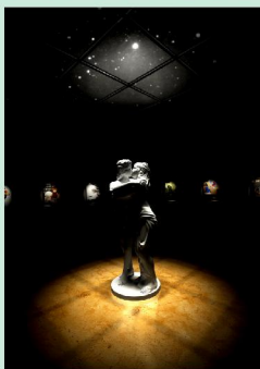
『ヨルノビジュツカン』

また、いろんな人の作品を見るというのは刺激になり自分自身奮い立たせると思っています。若いから、というのは死語かもしれませんが、若いうちに何か見えるってほんとスゴイことです。そう感じた事遊展でした。