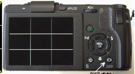
DISP ボタン 機種により異なる