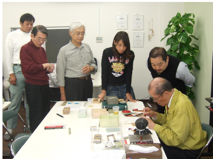
順番に手直しを受けているようす

ひたすらコリコリと彫っていきました。せっかくの下書き線もわずかのことで切れて、違う線に変わったりして、楽しいけれど難しさをヒシヒシと感じました。力の入れ具合で、石が割れてしまうことがあり、私の石も手直しの段階で割れてしまい、また一からとなりました。彫り終わった後、枠にわざと欠けを入れて、古び