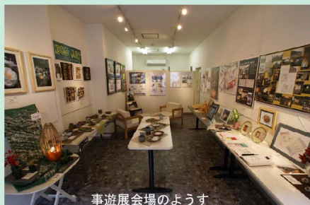
事遊展会場のようす

2点出品したうちの「ヨルノビジュツカン」は、少しネタをばらしめると、背景の額には自分の作品を入れて作っ