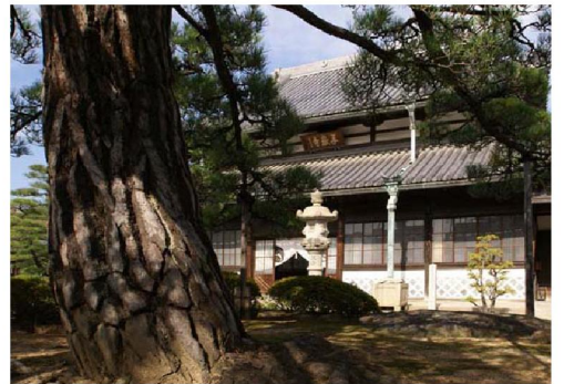
赤穂浪士ゆかりの花岳寺