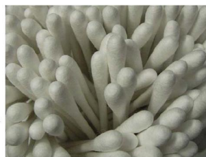
①白い綿棒 / 補正なし

露出補正の仕方は、このカメラの場合、①ADJ. またはMENUボタンを押す②ADJ. の場合はAを選びBを好みの値に合わせる。MENUの場合はCを選び調整する。MENUのうち頻りに操作する項目を選びAJD. に登録できる機種が多いので登録しておくとう便利です。これらは機種によって異なりますから、トリセツ(取扱説明書)で調べてください。