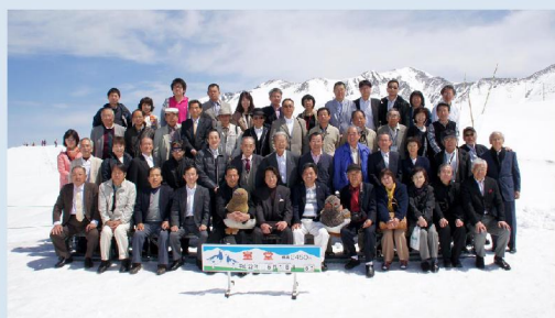
雪山をバックに(室堂)