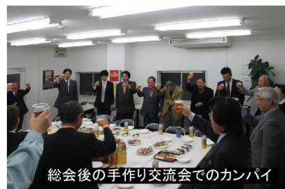
総会後の手作り交流会でのカンパイ

テリア設計士」と変えし、1年に1回、途切れることなく通算50回の実施、これは50年の歴史を積み重ねてきたことにほかならない。