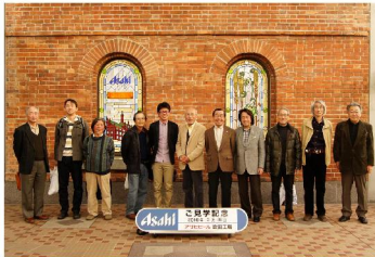
ほろ酔い気分で記念撮影

次の見学場所、アサヒビール吹田工場へは徒歩とJRで移動しゲストハウスに到着。企業PR映画『すべてのお客さまの「うまい!」のために。』で、吹田工場はアサヒビールの発祥の地で100年以上の歴史を持ち、1889年にアサヒビールの前身、有限会社大阪麦酒会を設立、2年後に操業開始したと説明を受け、案内係の誘導で工場内へ。原料展示では麦芽やホップを実際に触ることができ、仕込み室、発酵、熟成行程、濾過室等、CGと映像で解りやすく説明が有り、びん詰、缶詰行程等見学。見学当日は日曜日のため製造ラインが止まっていたのは残念であったが、1分間に缶ビール600個が自動で詰められると聞いてびっくりした。再資源化コーナーを通過してワールドビアコレクション3,500種6,000本の世界各国のビール缶が展示されている通路を抜けると工場見学は終了、待ちに待った出来たてビールの試飲である。スーパードライ、黒生、他にジュース等、おつまみ付きで時間は20分。1杯目スーパードライ、2杯目は黒生、それから・・・、美味しいビールのつぎかたの説明を聞きながらもう一杯。ほろ酔い気分