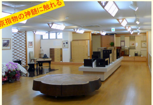
館内ようす(手前があるのが樹齢400年余りの吉野杉)