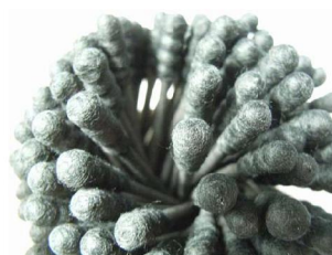
③黒い綿棒 / 補正なし