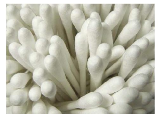
②白い綿棒 / 補正+1EV