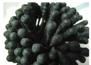
④黒い綿棒 / 補正-2EV