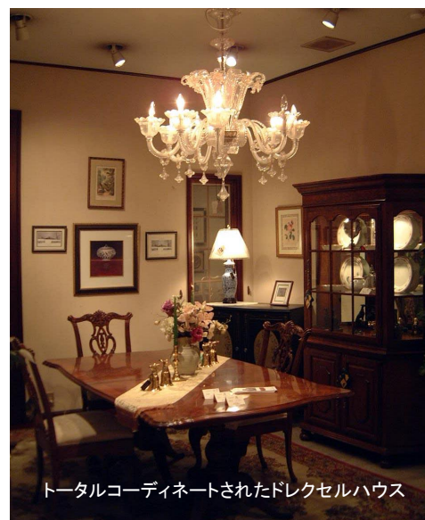
トータルコーディネートされたドレクセルハウス

家具になる木が丸太で輸入されることや、いったん漂白し着色することによって均一な色の作品に生まれ変わることに、大きなソファがたった一人の職人さんの手によって、見る見るうちに形を現す瞬間など、そこに居合わせた者にしか味わえない豊かな時間を過ごせた気がします。そして、時間を縫うように暮らす毎日に少し手を止めて、たまにはこんな贅沢な時間を過ごすのもいいものだと思います。