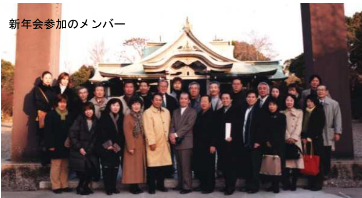
新年会参加のメンバー

どこへ行くのもバイク移動の私にとって電車で移動時間が読めなく、遅刻してしまい、迷惑をかけてしまいました。それ以上に、一番緊張したのは、雰囲気