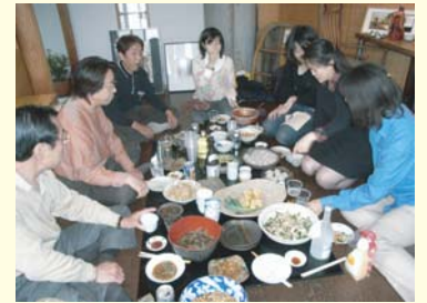
ホームパーティーの様子